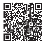
家庭ごみの分け方・出し方 雑がみリサイクル

各ご家庭や事業所から排出される可燃ごみの中にはリサイクル可能な紙類・布類が多く含まれています。環境負荷の軽減に向け、ごみの減量化・資源化にご協力ください。